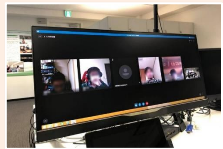
<テレワークインターンシップの様子>

さらに、インターンシップを通じて、教える側にも新しい学びがあることや、社会人インターンシップを実施した場合のほうがり着率が高いことも、メリットと考えている。