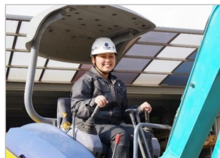
<近年中途採用された方>

育成に関しては、 幹部従業員がマンツーマン で行う。職種は、「工事スタッフ」「アドバイザー」「デザイナー」の3つを設けているが、社内の結束を高め、従業員同士の感謝し合う風土を醸成するために、 お互いの仕事を体験するジョブローテーション を行っている。