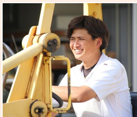
<近年中途採用された方>

職場体験後、採用面接に進むかは本人の希望次第だが、職場体験を実施することは、改めてこの会社で働きたいと思うかを判断することができる良い機会だと考えている。また、従業員と応募者が関わる時間が増え、職場の雰囲気が悪くなったとも感じている。加えて、採用後の定着率やその後の本人の成長、社内の雰囲気という点から見ても、職場体験の取組は大成功していると考えている。