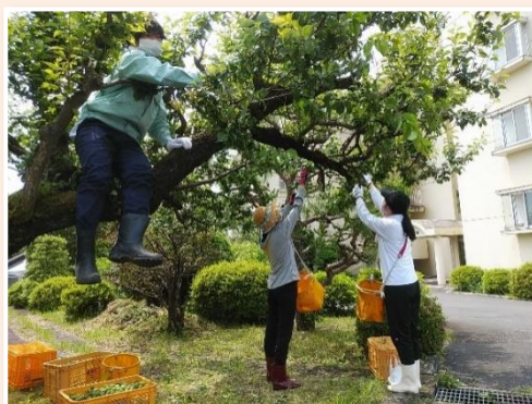
<敷地内の梅の収穫の様子>