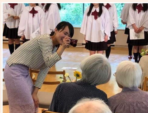
<居住者の方と一緒に合唱会へ参加>

職場体験により、法人側も参加者側も相互に理解が深まっていると感じている。実務を見たり体験することで、仕事への興味がより深くなるほか、本人の不安や悩みなどもある程度解消できるため、本人が納得した上で就職していただくための良い機会になっていると考えている。また、職員も、参加者に教える側に立つことで新たな気づきが得られ、成長に繋がっている。