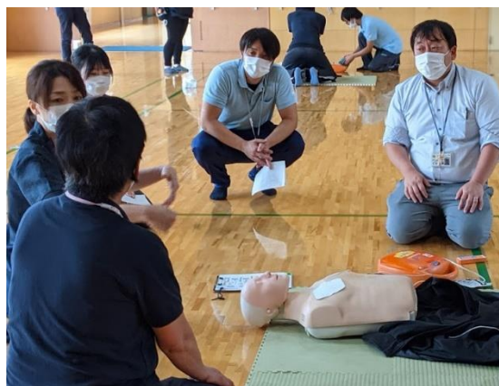
<職員研修での救命講習>

直近5年間の中途採用者12名のうち、9名は就職氷河期世代（35歳～49歳）に該当し、うち4名は前職が美容関係や整体師などの業界未経験者であった。新型コロナウイルス感染症の影響で前職（サービス系の職種）が不安定になってしまった未経験者の採用も行った。