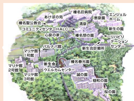
〈社会福祉法人新生会 全景〉