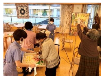
〈居住者の方と小正月の準備〉

採用後は、法人全体の研修として3月下旬に2泊3日で宿泊研修を行い、当法人の沿革説明や施設見学、高齢者の心理とケア、高齢者のケアワーク、安全衛生学等の座学、そして実際の現場でのワークを行った上でふりかえりを行う。また、1ヶ月実際の業務を行った上で、5月に1日間のフォローアップ研修を行っており、看護師や栄養士による座学、施設長とソーシャルワーカーとのグループディスカッション、ふりかえりを通して、不安や悩みを共有、解消を図っている。その他に、配属された施設ごとに研修を行っている。