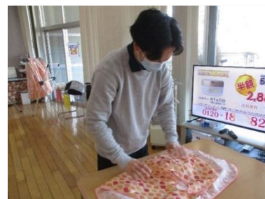
<業務にあたる従業員の方>

今は、子育て世代の方などを意識し、法人内での保育所と連携するなど、働きやすい、休みを取りやすい環境づくりを心掛けている。