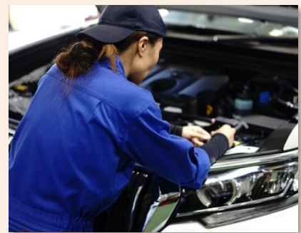
<近年採用された元営業職の社員>

社会人インターンシップは、面接より把握できることが多く、応募者の仕事に対する考え等も丁寧に聞くことができる。まだ開始して2年程だが、互いに納得しての入社となるため、採用のミスマッチは防げていると考えている。