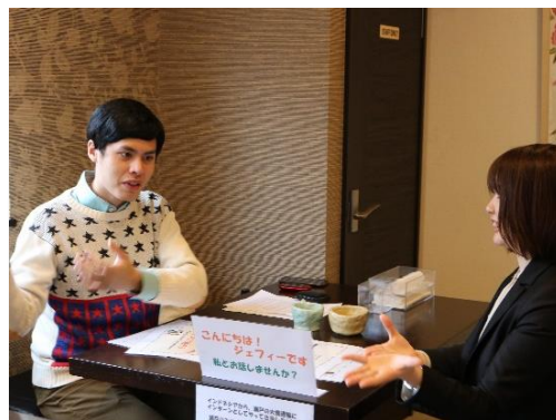
<インドネシアからのインターンシップ参加者の様子>

また、人材育成の一環として、資格取得に関するものや仕事に関連する図書等の費用を負担している。