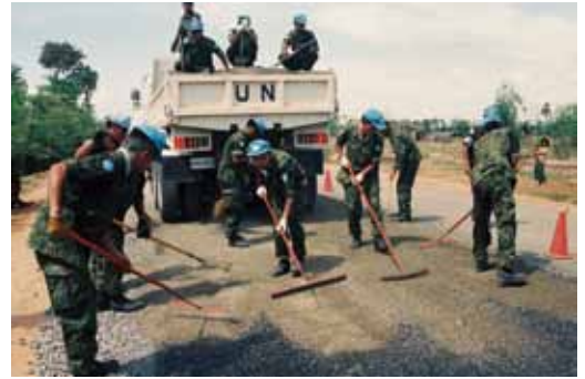
▲カンボジア国際平和協力業務 (1992年9月～1993年9月)