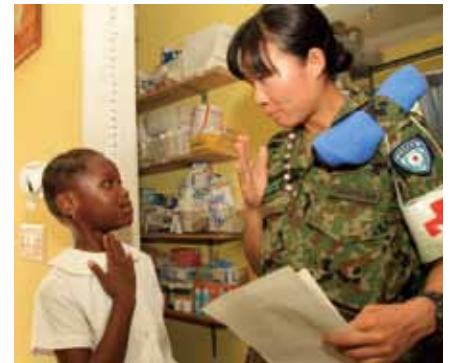
▲ハイチ国際平和協力業務 (2010年2月～2013年2月)