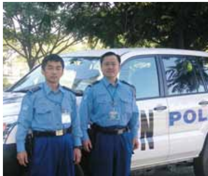
▲東ティモール国際平和協力業務 (2007年1月～2008年2月)