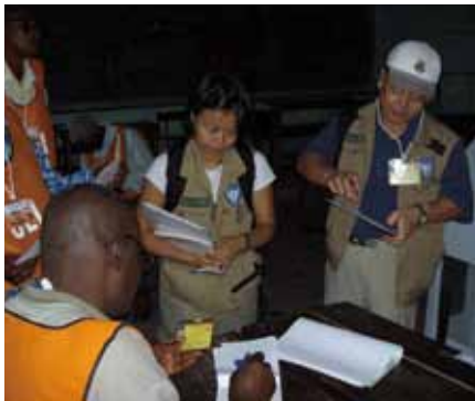
▲コンゴ民主共和国国際平和協力業務 (2006年7月～2006年11月)