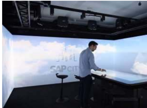
SAP Immersive Experience デジタル体験の場

「Inspire」、「Ideate」、「Develop」サービスの提供を通じて、クライアントの皆様オープンイノベーションの支援、新規事業発掘支援を行います