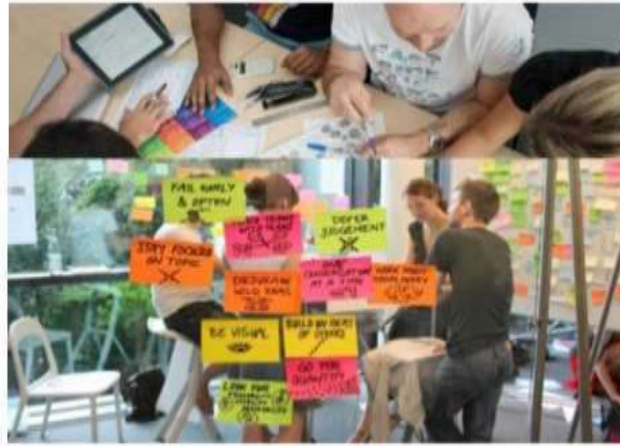
Networking/ design thinking 議論の場