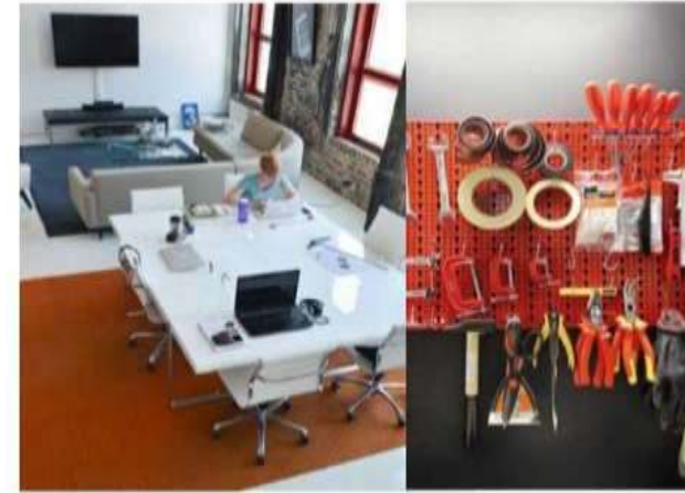
Project rm./ Makers rm. 創出の場