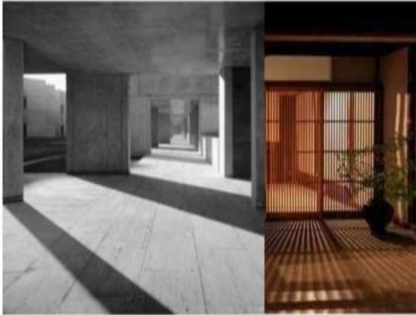
Entrance 気持ちの入れ替えの場