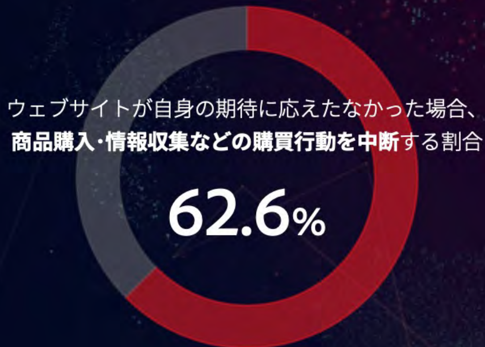
◎ウェブサイトにおける問題が消費行動に与える影響