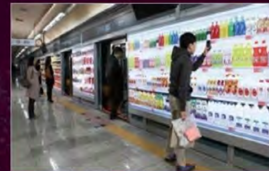
TESCO Home Plus