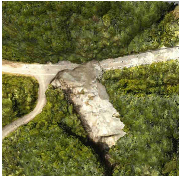
【佐賀土砂崩れ被害状況撮影結果(3次元データ)】