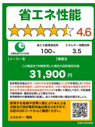
(電気温水機器のイメージ)

※温水機器以外は、製品のサイズやネット取引等の限られたスペースで使用する場合は右側のミニラベルを活用すること。