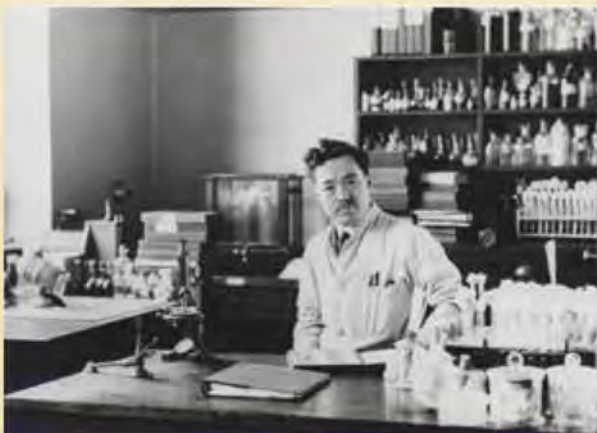
ロックフェラー医学研究所の研究室での野口英世博士

野口博士は、ニューヨーク・ブロンクス区のウッドローン墓地に埋葬されています。墓碑銘には「博士は、科学への献身により、人類のために生き、人類のために死せり」と書かれています。なお、野口博士は、日本の科学者として初めて日本のお札（1000円札）の肖像に選ばれました（2004年）。