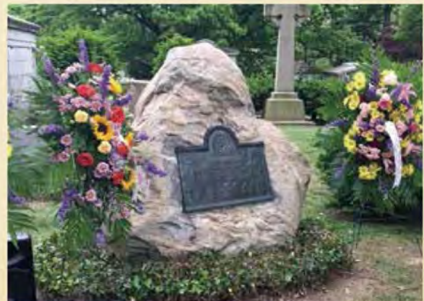
ウッドローン墓地に眠る野口英世博士の墓