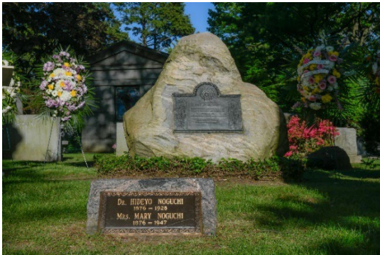
(Stèle du Dr Hideyo Noguchi)