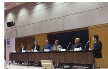
Colloque organisé par la JICA, le PNUD et le bureau du Cabinet