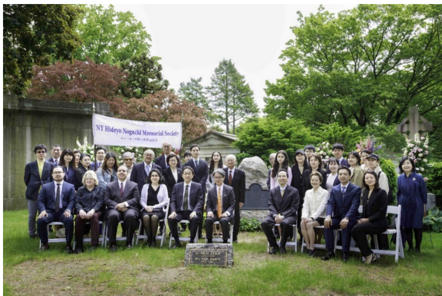
« Visite de la tombe de Hideyo Noguchi pour le 96ème anniversaire de son décès »