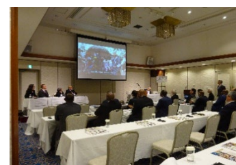
Conférence et table-ronde organisées par l'Association japonaise pour l'Afrique