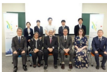
Visite à l'Université municipale de Yokohama et dialogue avec les professeurs