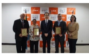
Visite de courtoisie au préfet de Fukushima et remise d'un certificat d'Ambassadeur spécial de bonne volonté pour les échanges internationaux