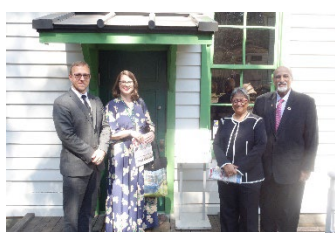
Nagahama Hall (ancien laboratoire de bactériologie)