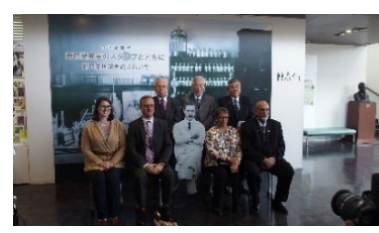
Visite de la Société commémorative de Hideyo Noguchi