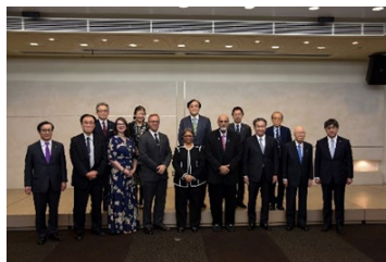
Conférence commémorative organisée par la Nippon Medical University