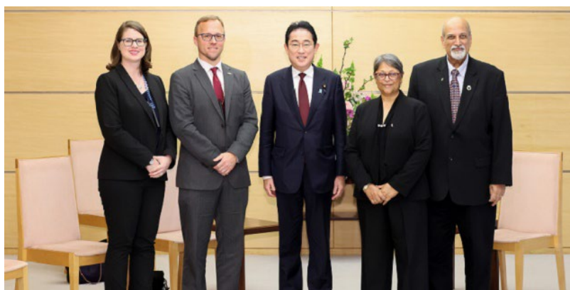
Visite de courtoisie au Premier ministre Kishida

Le programme d'invitation au Japon des lauréats du 4ème Programme d'invitation des lauréats du Prix Hideyo Noguchi pour l'Afrique s'est déroulé du 13 au 17 mars 2023.