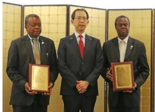
国際交流特別親善大使認証書授与式