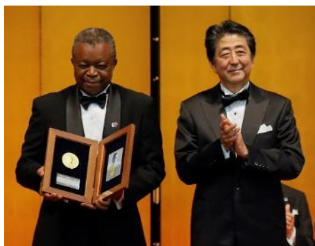
ムエンベ＝タムフム博士（医学研究分野受賞者・写真左）、オマスワ博士（医療活動分野受賞者・写真右）