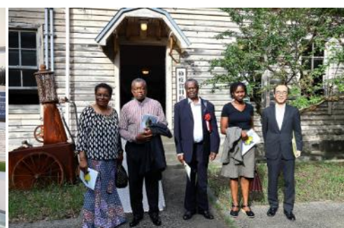
旧長濱検疫所一号停留所の視察