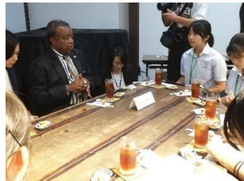
会津若松の高校生たちと交流