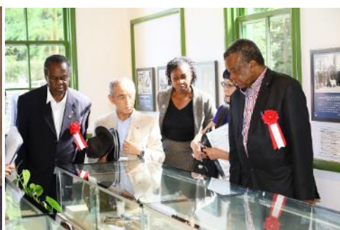
旧細菌検査室の視察