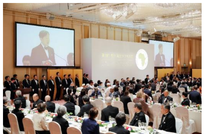
記念晩餐会の様子