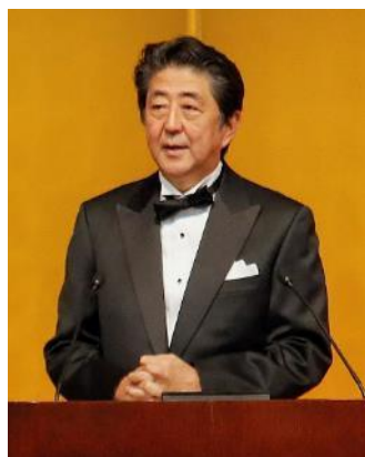
安倍 内閣総理大臣