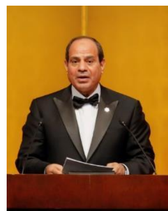
エルシーシ エジプト・アラブ共和国大統領