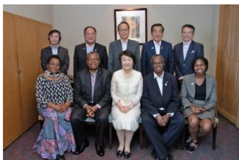
横浜市長主催昼食会