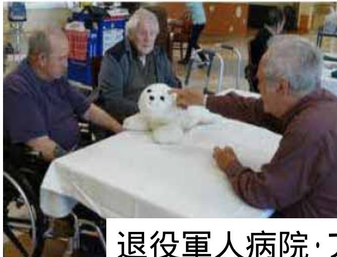
退役軍人病院・アメリカ