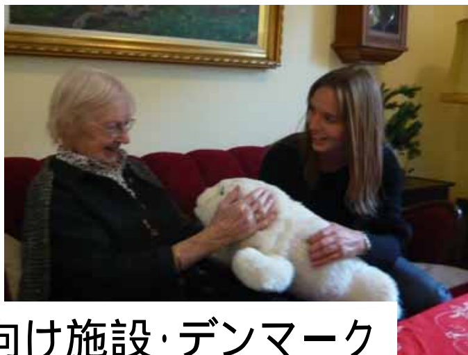
高齢者向け施設・デンマーク