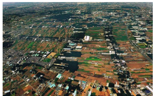
三富新田。高速道路開通で都市化するなか、雑木林と屋敷林のみどりの帯が残る。進士さんは、「世界農業遺産」登録を目指す。

「私は庭園の“用と景”に多くを学びました。安全で便利であること、美しいこと、水が循環して生きものが生きられること、社会の求めに応じられること、地域らしきがあり故郷を感じられることなどです。この原則 げんそく に根ざしたまちづくりをこれからもすすめていきたいと思います」。