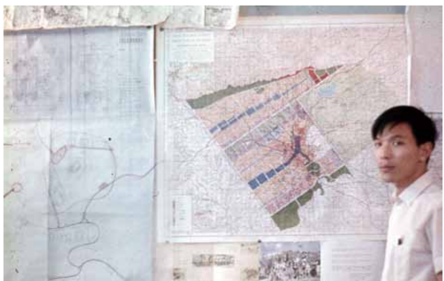
イスラマバードの街に植えられた苗木（左）。新しい首都の計画図をバックに（右）。