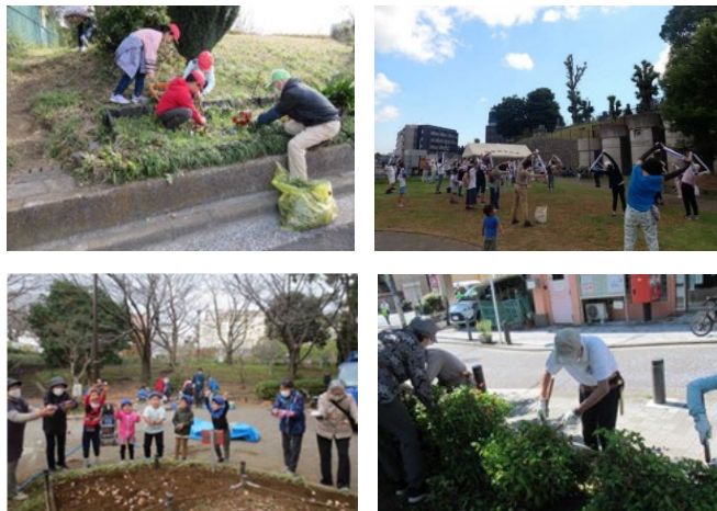
公園愛護会の活動の様子