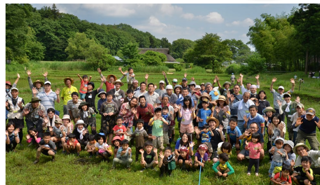
里山の風景づくりを通してグリーンコミュニティが醸成