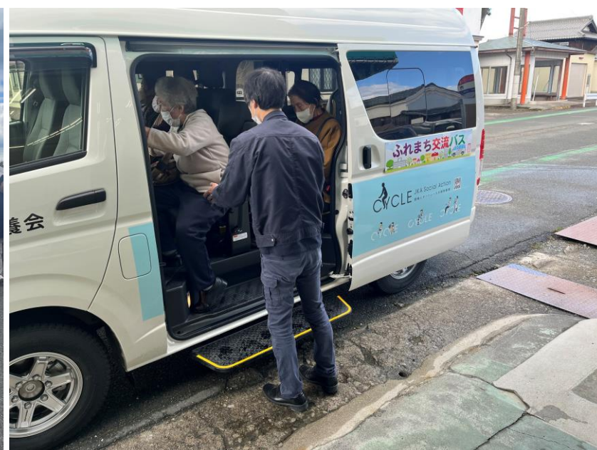
ふれまち交流バスの送迎