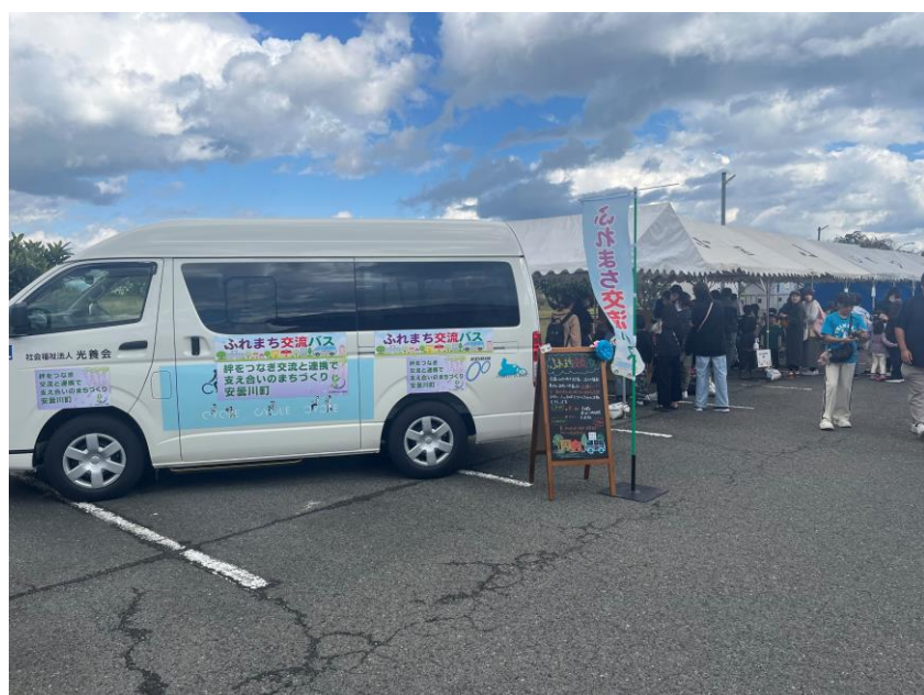
ふじの里地域交流事業で事業・車両紹介