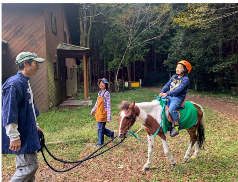
合同イベント ふれあい乗馬