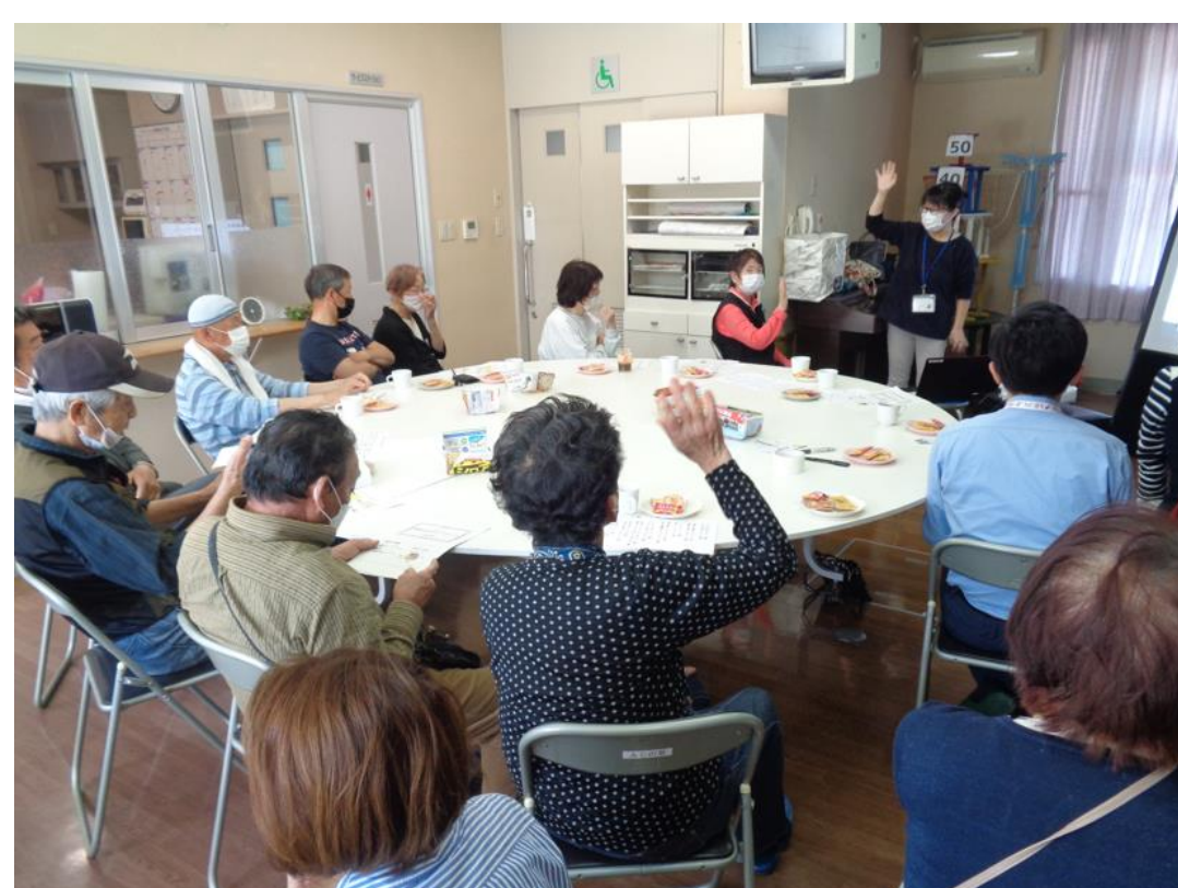
ふじの里で交流(ふじカフェ)