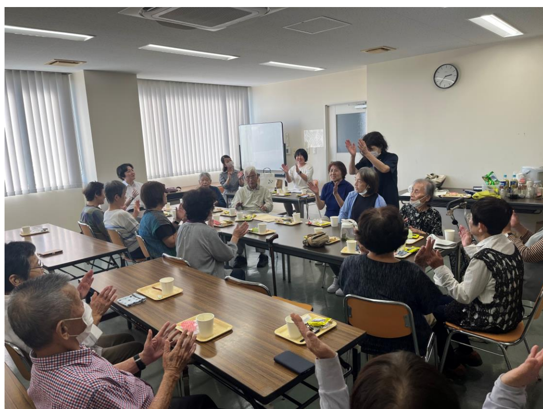
地域のサロンで交流