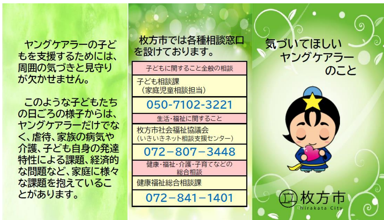
図表 「ヤングケアラー啓発カード」