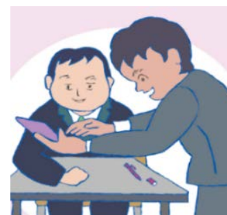
意思を伝え合うために絵や写真のカードやタブレット端末などを使う

注: 「障害を理由とする差別の解消の推進に関する基本方針」(平成27年2月24日閣議決定)に基づき作成