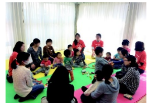
若者世代の入居と多世代交流の促進