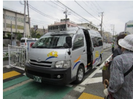
コミュニティバスの導入等