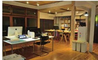
住宅をシェアオフィス等として活用