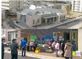
高齢者施設や店舗の誘致

居住者の高齢化等により多様な世代の暮らしの場として課題が生じている住宅団地について、生活便利施設や就業の場等の多様な機能を導入することで、老若男女が安心して住み、働き、交流できる場として再生