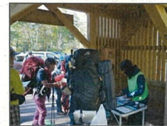
・利用者負担の仕組みづくり