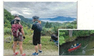
・アドベンチャートラベルの展開