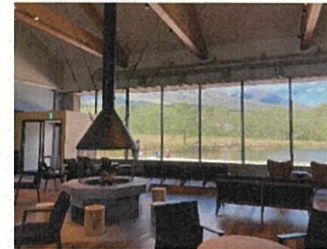
・ビジターセンター等の整備