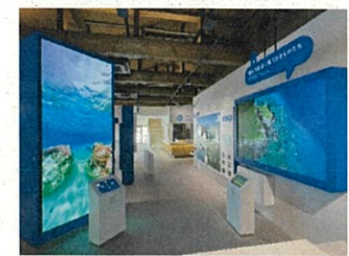
・デジタル展示の導入

お問合せ先： 環境省自然環境局国立公園課：03-5521-8277 / 国立公園利用推進室：03-5521-8271 / 自然環境整備課：03-5521-8280