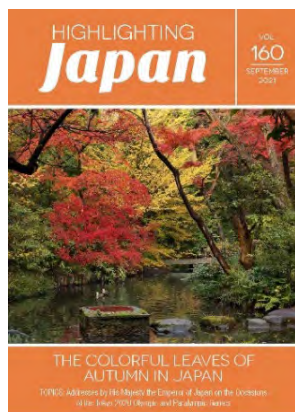
9月：紅葉いろどる日本の秋