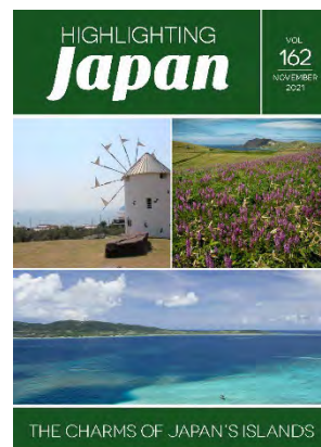
11月：日本の島の魅力