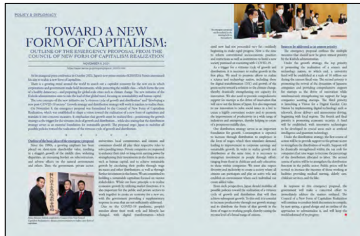
(新しい資本主義の実現に関する記事)