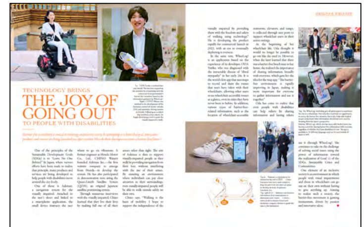
(バリアフリー技術に関する記事)