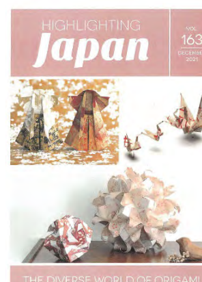
12月：多様な折り紙の世界