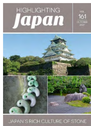
10月：日本における石の文化