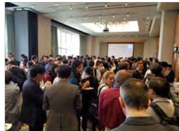
海外バイヤーとの ネットワーキング支援