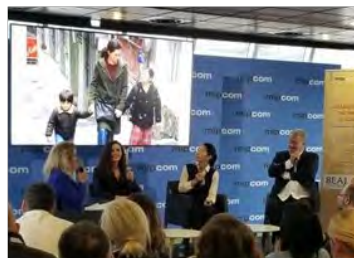
海外有力制作者の 招聘・セミナー