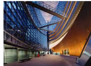
海外バイヤーの参加 を促す取り組み