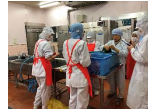
コーディネーターによる給食現場への指導