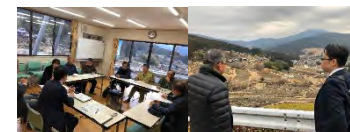
課題に応じた専門家の派遣・指導