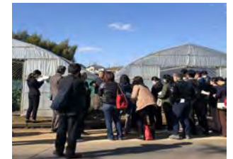
地産地消コーディネーター育成研修会の現地視察