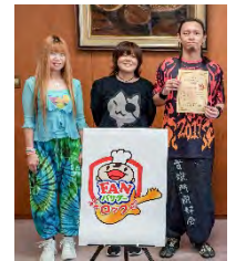
著名人をFANバサダーに任命し、消費者に国産農産物の魅力を発信