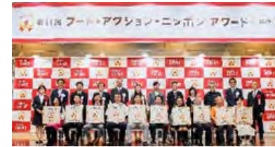
フード・アクション・ニッポン アワードで地域の優れた産品を表彰