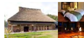
古民家を活用した滞在施設