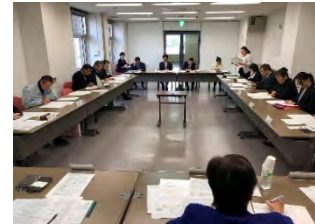
コーディネーターによる生産現場と学校給食の課題・ニーズの調整