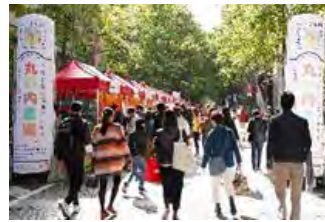
ジャパンハーヴェストによる国産農林水産物の魅力発信