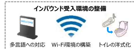
インバウンド受入環境の整備