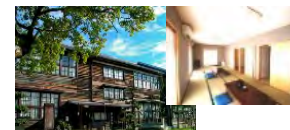
廃校を改修した大規模滞在施設