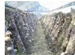
きのご生産施設の整備