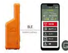
携帯圏外でもチャットや SOSが発信可能な装備