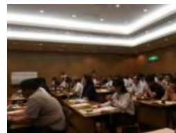
集合研修により輸出等に 必要な知見を提供