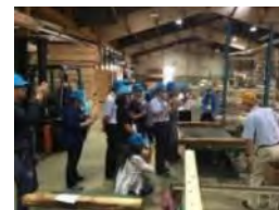
製品事業者との連携等、販売 力強化に関する研修の実施