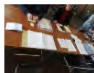
合法性の確認の実施状況の調査