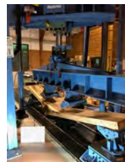
輸出先国の規格基準に対応した性能検査