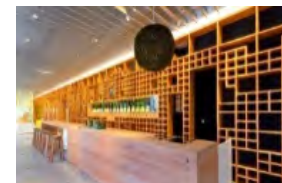
日本産木材製品のPR