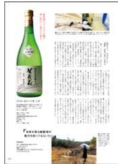
▶右：「Discover Japan Vol.96」 （株）ディスカバー・ジャパン、2019.3.6発行、91頁）