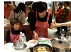
包装米飯を用いた調理セミナー