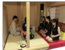
茶室体験イベント