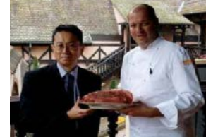
海外日本食材使用レストランとの連携

(1、2①の事業) 食料産業局輸出促進課 (03-6744-7172) (2②の事業) 食料産業局食文化・市場開拓課 (03-6744-0481)