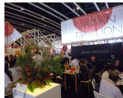
海外見本市での商談