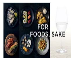
日本酒情報サイトの立ち上げ