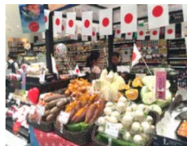
青果物の販売促進活動