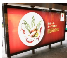
水産物バス停広告