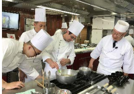
海外料理学校との連携