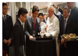
総理によるトップセールス