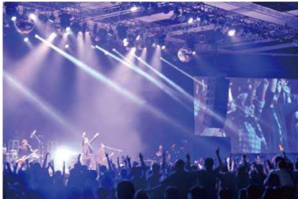
東京スカパラダイスオーケストラ JAPAN NIGHT in Jakarta @ The Kasablanka 2015年4月4日

・アニメなど過去の 映像作品のアーカイブを整備し、 訪問者が自由に閲覧できる 拠点を構築 (竹芝地区の国家戦略特区を活用)