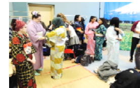
浴衣の着付け体験 (平成29年11月@カナダ) (在外公館文化事業)