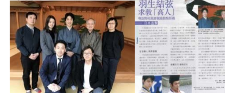
「狂言を通じた日中文化交流」をテーマとする野村万作・萬斎氏への取材及び発信例 (平成30年3月，中国記者グループ) (報道関係者招へい)