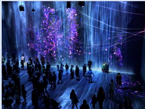
「teamLab 境界のない世界」展(於ラヴィレット)には、30万人以上が来場