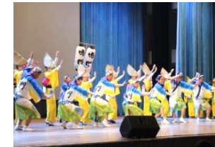
阿波踊り公演 (平成30年1月@スリランカ) (在外公館文化事業)