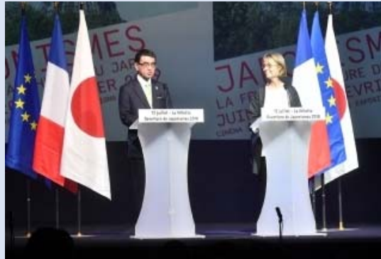
河野外務大臣およびニッセン仏文化大臣による開幕スピーチ(2018年7月)