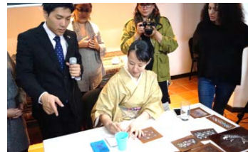
日本伝統のデザインと切り絵について講演 (平成30年2月@コロンビア，ブラジル， エクアドル)(日本ブランド発信事業)