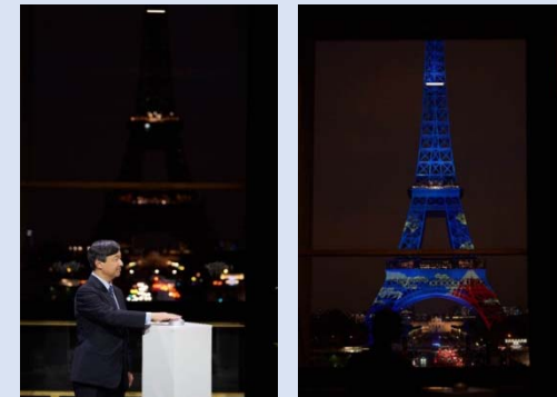
「エッフェル塔特別ライトアップ」(2018年9月)は皇太子殿下による御点灯式典も併せて実施。日仏メディアを中心に多数の報道あり。