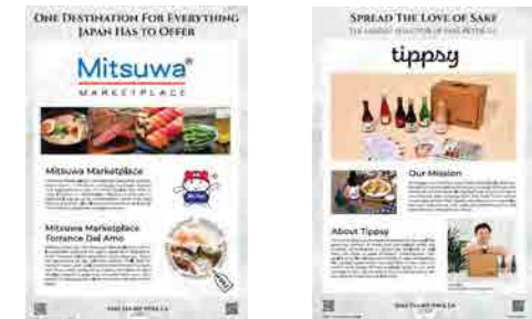
(上: イベントの様様、下: 近隣店舗等の紹介)