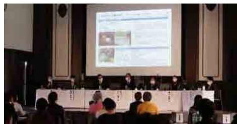
(パネルディスカッションの様様)