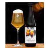
(山梨県産フルーツ)