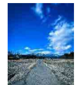
(ハケ岳の新鮮な空気)