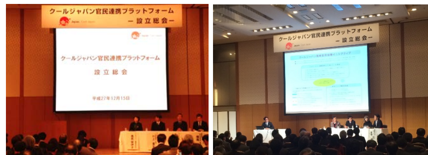
写真：設立総会（H27.12.15）の様