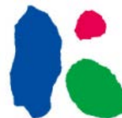
シンボルマーク 「ビビッドK」