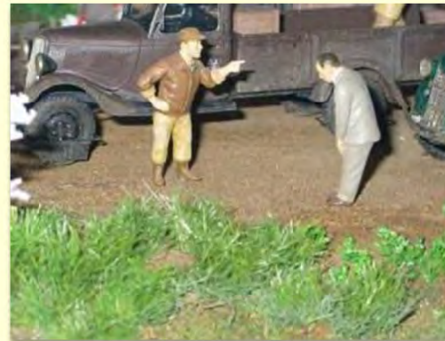
＜当時の実情を伝えるジオラマ＞