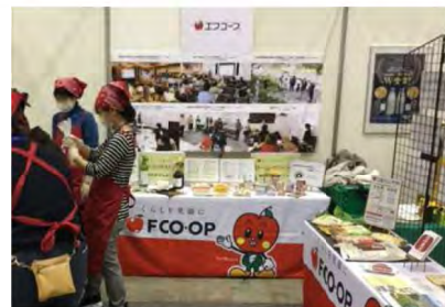
防災イベントの様子 (ローリングストックの紹介)