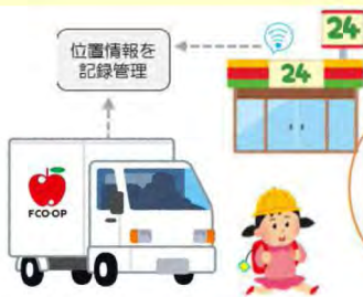
児童が身に付けている端末機