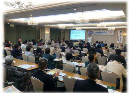
2019年度憲法「檻の中のライオン」