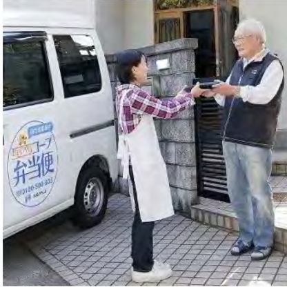
宅配や配食サービスを基盤に高齢者を見守り