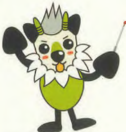
長野県消費者被害防止啓発キャラクター もシカっち