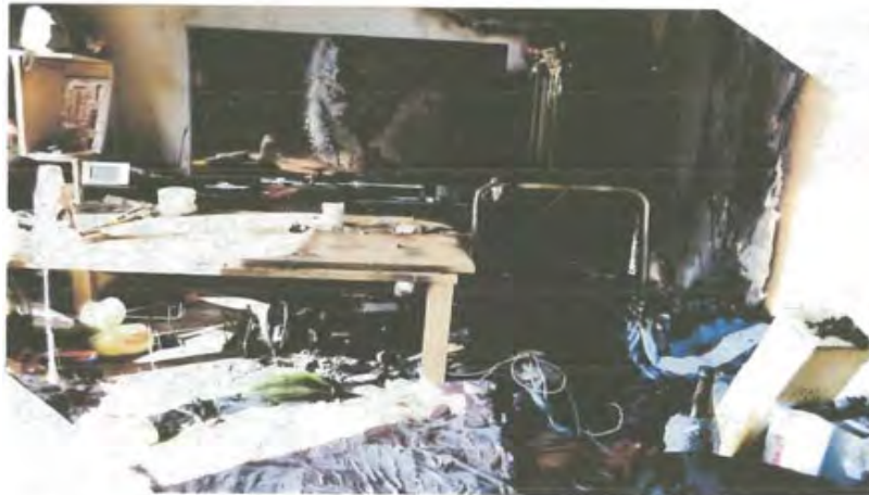
第2回デジタル・プラットフォーム企業が介在する消費者取引における環境整備等に関する検討会 資料4