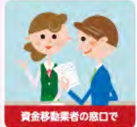
資金移動業者の窓口で