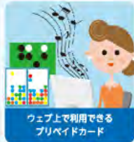
ウェブ上で利用できるプリペイドカード