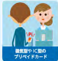
磁気型や IC 型のプリペイドカード