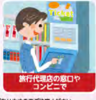
旅行代理店の窓口やコンビニで