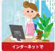
インターネットで