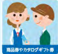
商品券やカタログギフト券