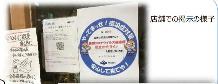
店舗での掲示の様子

大阪コロナ追跡システムや、感染防止宣言ステッカーの導入・利用促進にあたり、企業の会員向け機関誌への掲載や、リーフレットの作成、対象となる取引先飲食店等へのきめ細やかな導入サポート等、府と包括連携協定を締結している企業・団体をはじめ、多くの企業にご協力いただいています。