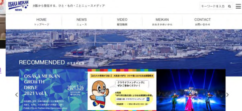
ニュースサイト(OSAKA MEIKAN NEWS)

https://meikan.osaka/prefecture/osakapref-ch