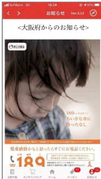
アプリ(ドラッグストア)