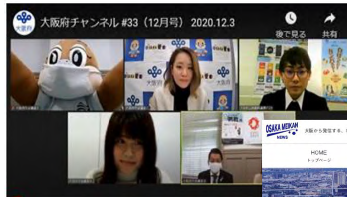
インターネットテレビ

https://meikan.osaka/prefecture/osakapref-ch