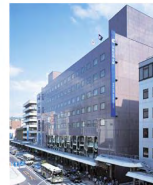
本店（京都市下京区）