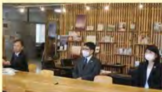
関西広域連合サステナブル経営推進セミナー (R2.11.9)