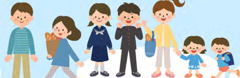
学生・生徒・保護者