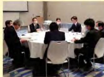
消費者志向自主宣言フォローアップ・セミナー (R3.1.25)

【事業者団体】徳島経済同友会、徳島県経営者協会、徳島県商工会議所連合会、徳島県商工会連合会、徳島県中小企業団体中央会、徳島県中小企業同友会