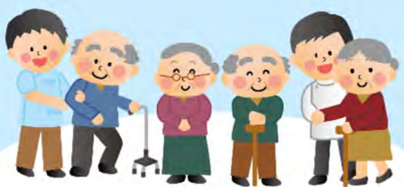
高齢者・障がい者