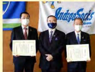
徳島県消費者志向経営推進事業者表彰式 (R3.2.3)