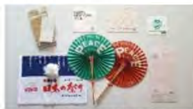
再生パルプを用いた製品の例

広島平和記念公園には、年間10トンもの折鶴が捧げられており、一定期間展示された後、倉庫で保管されてきた。日誠産業では「恩返しプロジェクト」として折鶴から再生パルプを制作し、新たな商品として平和への思いを伝えることに取り組んでいる。