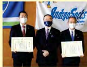
徳島県消費者志向経営推進事業者表彰式 (R3.2.3)