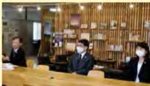
関西広域連合サステナブル経営推進セミナー (R2.11.9)