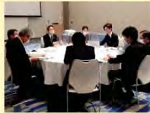
消費者志向自主宣言フォローアップ・セミナー (R3.1.25)

【事業者団体】徳島経済同友会、徳島県経営者協会、徳島県商工会議所連合会、徳島県商工会連合会、徳島県中小企業団体中央会、徳島県中小企業同友会