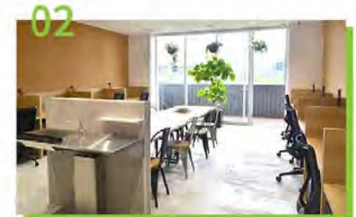
気軽に働けるスペースが欲しい方に シェアオフィス