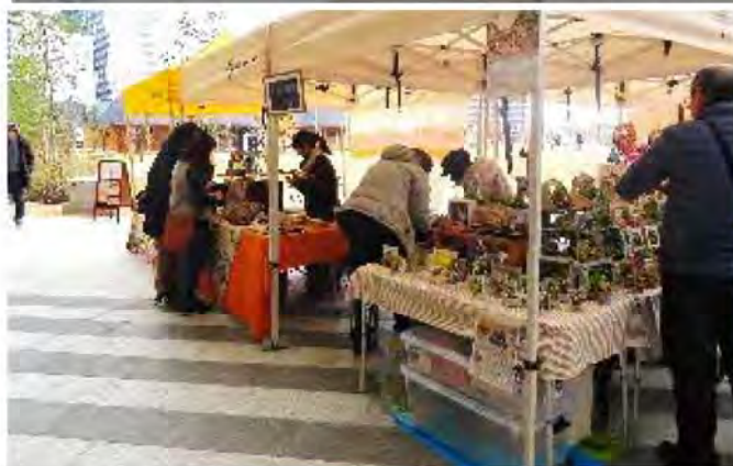
ブランチパーク手作りマルシェ