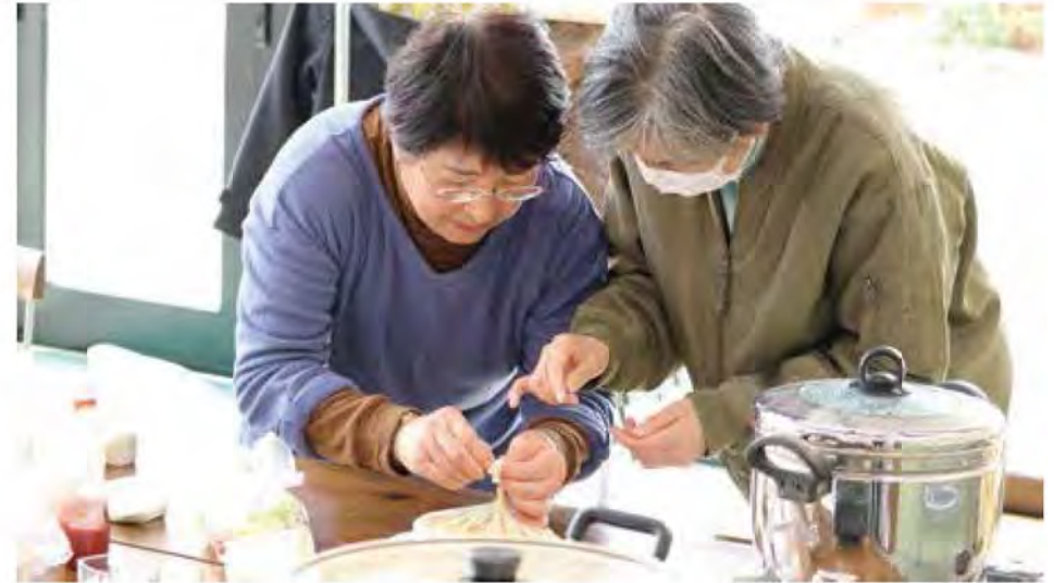
非常食ワークショップ