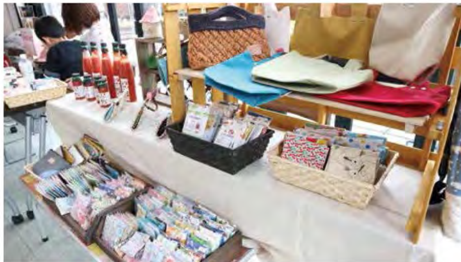
ハンドメイドマルシェ