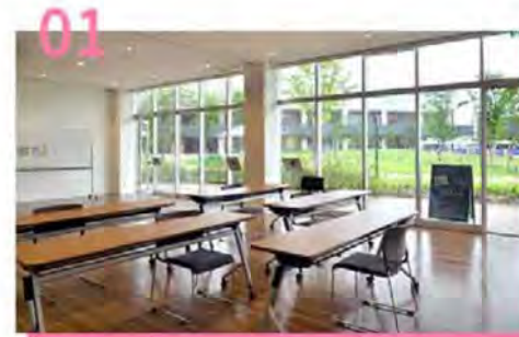
いろんな「やってみたい」がある方に シェアスペース