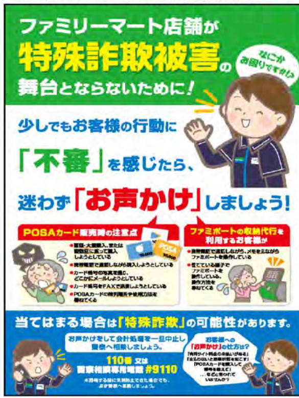
■従業員向け 事務所掲出ポスター