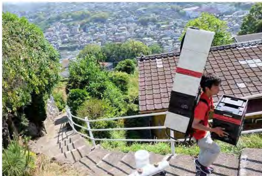
車の入れない山腹の家庭にもお届け