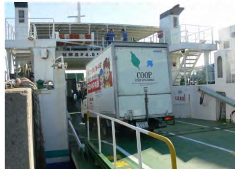
152の離島（全有人島の36.4%）の組合員 1万7千人以上（24生協）が毎週利用 （※2014年数値）