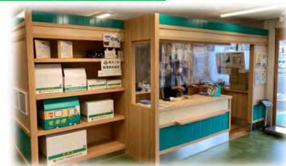
サービスカウンター