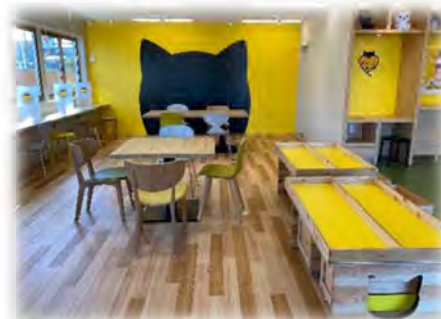
地域の方にご活用いただける店舗内コミュニティスペース