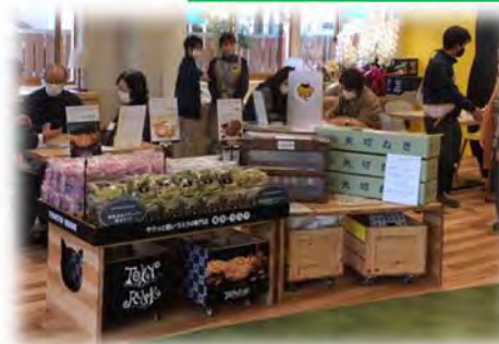
地域の特産品の販売 （写真は矢切ねぎ、東京ラスク）