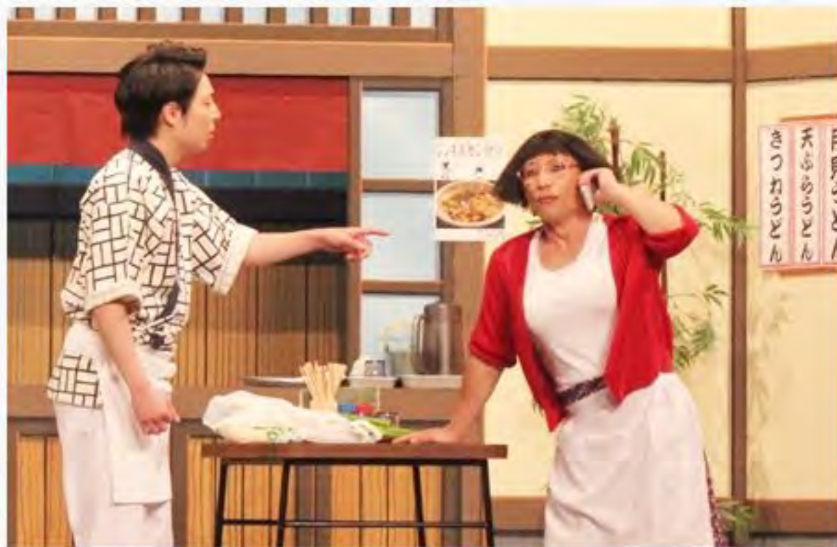
「みんな花月 特別興行」で吉本新喜劇が消費者庁とコラボ