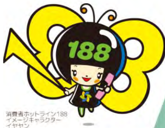
消費者ホットライン188 イメージキャラクター イヤヤン