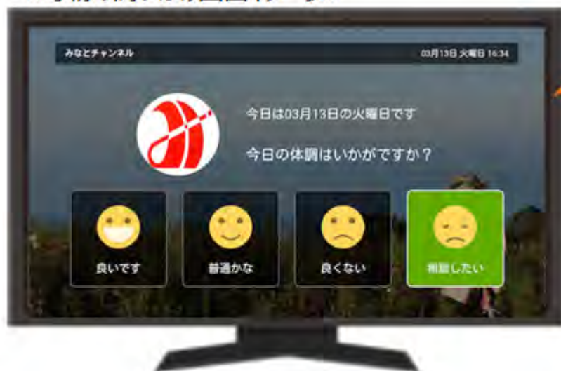
《毎朝の問いかけ画面イメージ》