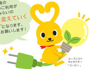
コープこうべ キャラクター 「コービー」

組合員の みなさんのご利用が 日本のみらいの 電源構成を変えていく “ちから”になります。 ぜひご協力をお願いします！