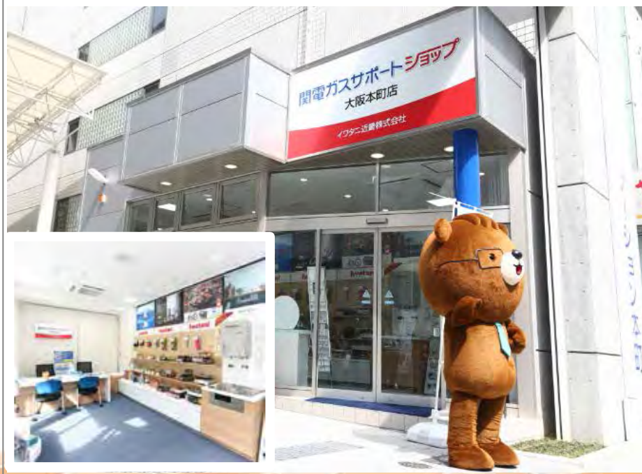
関電ガスサポートショップ 旗艦店