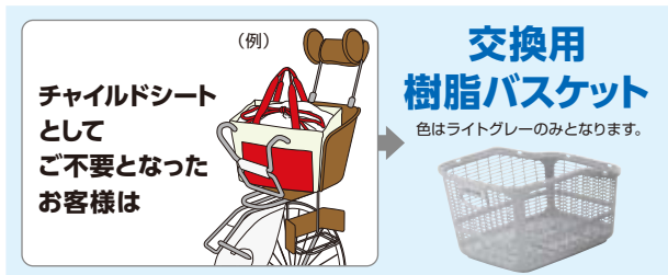
リコール対象商品 12モデル(色は一例です)