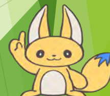
イメージキャラクター コンちゃん