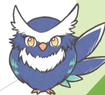
イメージキャラクター コミズク