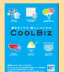
(クールビズポスター)