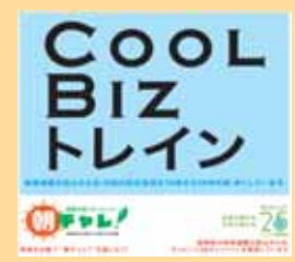
(クールビズトレインステッカー)