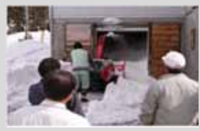
(雪冷熱エネルギー活用) 地域での温暖化防止の取組支援