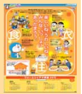
(ウォームビズ告知広告)