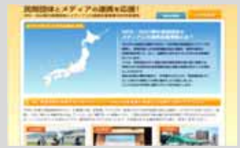
NPO等とメディアとの連携支援事業