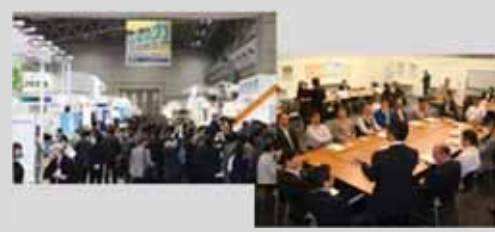
省CO2設備の紹介、エコビジネスの促進