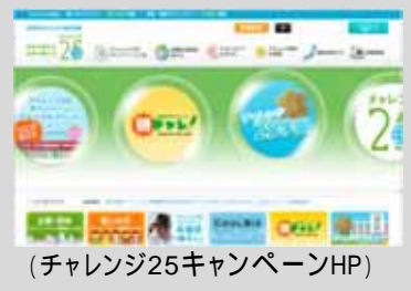
(チャレンジ25キャンペーンHP)