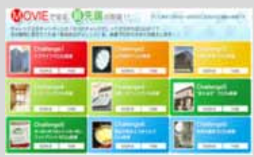
最先端の環境技術を映像で紹介