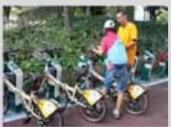
(名チャリプロジェクト)