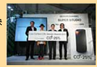
(低炭素ライフスタイルに関する技術提案の表彰)