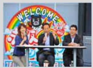
(CO225%削減表明一周年記念イベント)