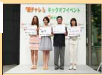
(朝チャレ！キックオフイベント)