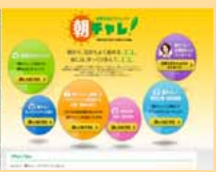
(朝チャレ！HPイメージ)